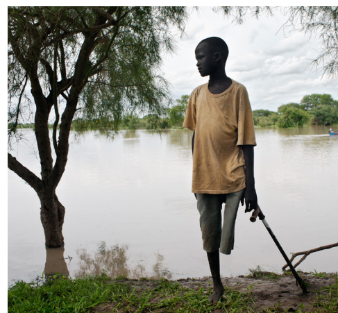
Un jeune garçon avec une jambe amputée après avoir été mordu par un serpent, dans l'état de Jonglei au Sud-Soudan.

L'empoisonnement par morsure de serpent est une question qui a été trop longtemps négligée. Les organismes mondiaux de la santé, les bailleurs de fonds, les gouvernements et les compagnies pharmaceutiques doivent prendre la responsabilité de mettre cette question à l'agenda mondial de la santé, et prendre des mesures collectives et immédiates pour répondre à cette urgence majeure de santé publique.